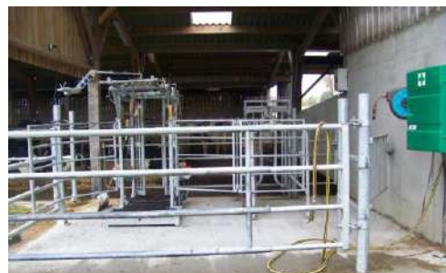
Zone dédiée aux soins ... notamment au parage qui se réalise dans le confort, la sécurité de l'homme et de l'animal