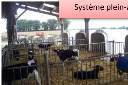
La nurserie Système plein-air partiel